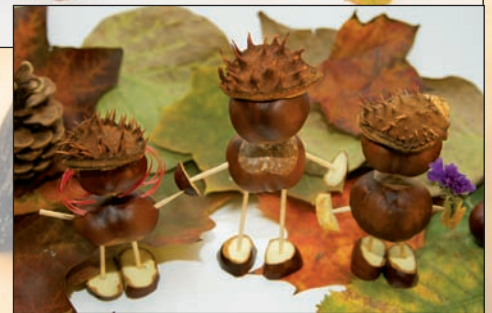
Kreatives Basteln mit Kastanien

weisen - und um die Geister von Zuhause fernzuhalten werden Kürbisse zum Mitnehmen geschnitzt und die Gesichter von Clown Anton mit bunten Herbstmotiven bemalt.