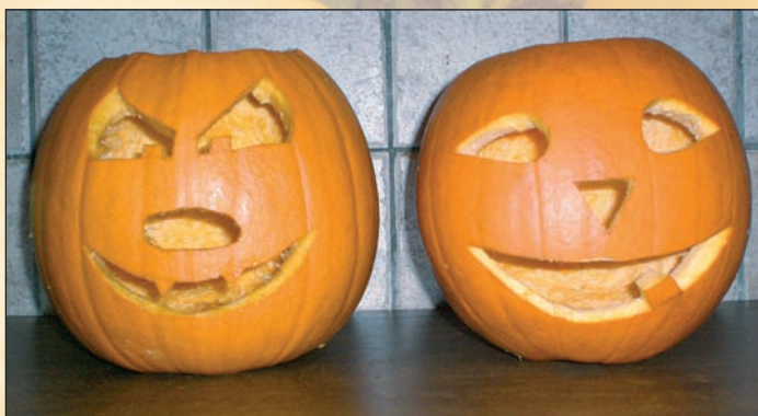
Kürbisgesichter für Halloween

Für Ihr leibliches Wohl und für Ihren speziellen Halloween-Einkauf wird